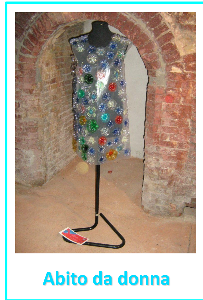
Abito da donna