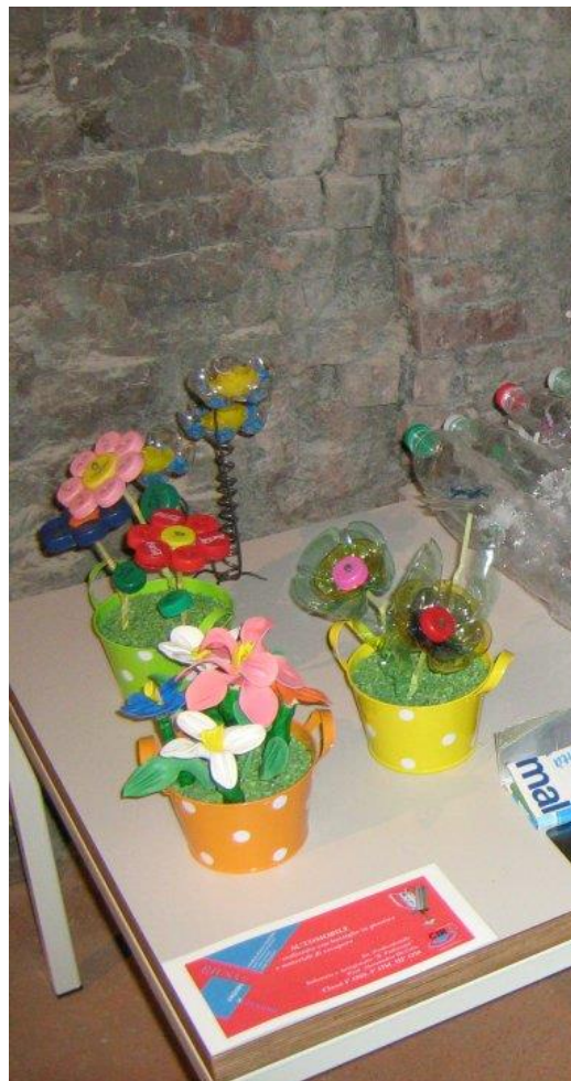
Vasi floreali decorativi

è un progetto educativo e promosso, in collaborazione servizio di igiene urbana Amministrazioni comunali primarie della Provincia. Per stimolare la propria gli alunni incontrano personaggi di fantasia.