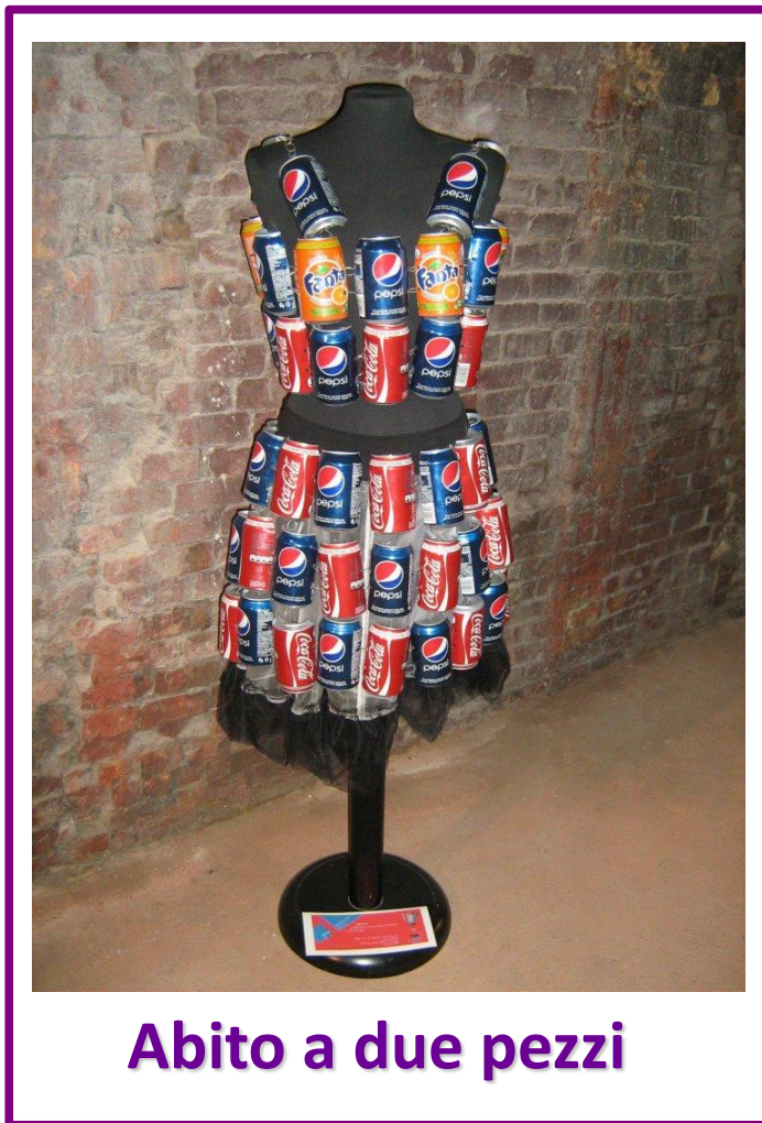
Abito a due pezzi

è un progetto educativo e promosso, in collaborazione con il servizio di igiene urbana, dalle Amministrazioni comunali e delle Province. Per stimolare la partecipazione degli alunni incontrano i personaggi di fantasia: